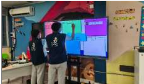
Información de la fotografía: Desarrollo de proyectos del aula STEAM