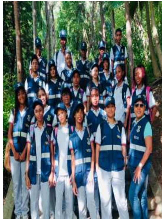
Información de la fotografía: ejecución de proyecto trasnversal PRAE