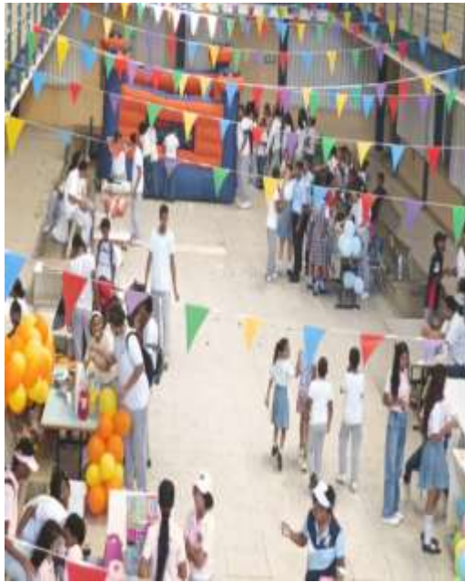
Información de la fotografía: feria de emprendimiento